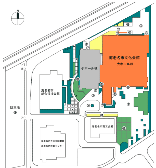
海老名市文化会館全体図

メールアドレス: motoyama-nhg@pref.yamanashi.lg.jp